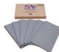
Kit Bandeja Mini Porta Pallets