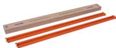
Kit Longarina Mini Porta Pallets