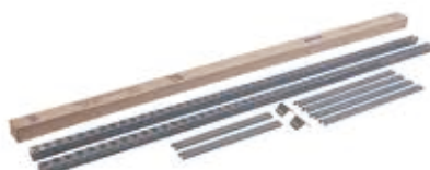
Kit Coluna Mini Porta Pallets